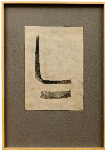
Sin título (Ref. 21/14), 2014 Sumi y collage sobre papel 31 x 22 cm 2,800.00€ + IVA