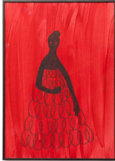
Rosalía Banet Sin título , 2021 Acrílico y lápiz sobre papel 42 x 30 cm 1.000 € + IVA