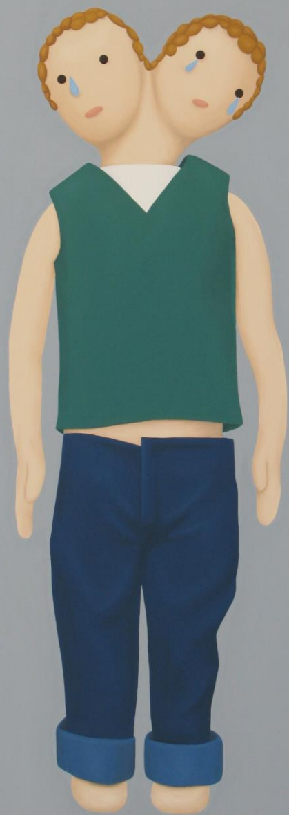
Rosalía Banet Bicéfalo llorón , 2010 Óleo sobre lienzo 180 x 130 cm 8.000 € + IVA