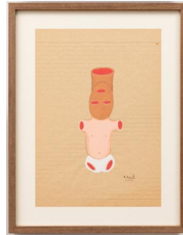
Rosalía Banet Sin título , 2022 Acrílico sobre papel 25 x 18 cm 800 € + IVA