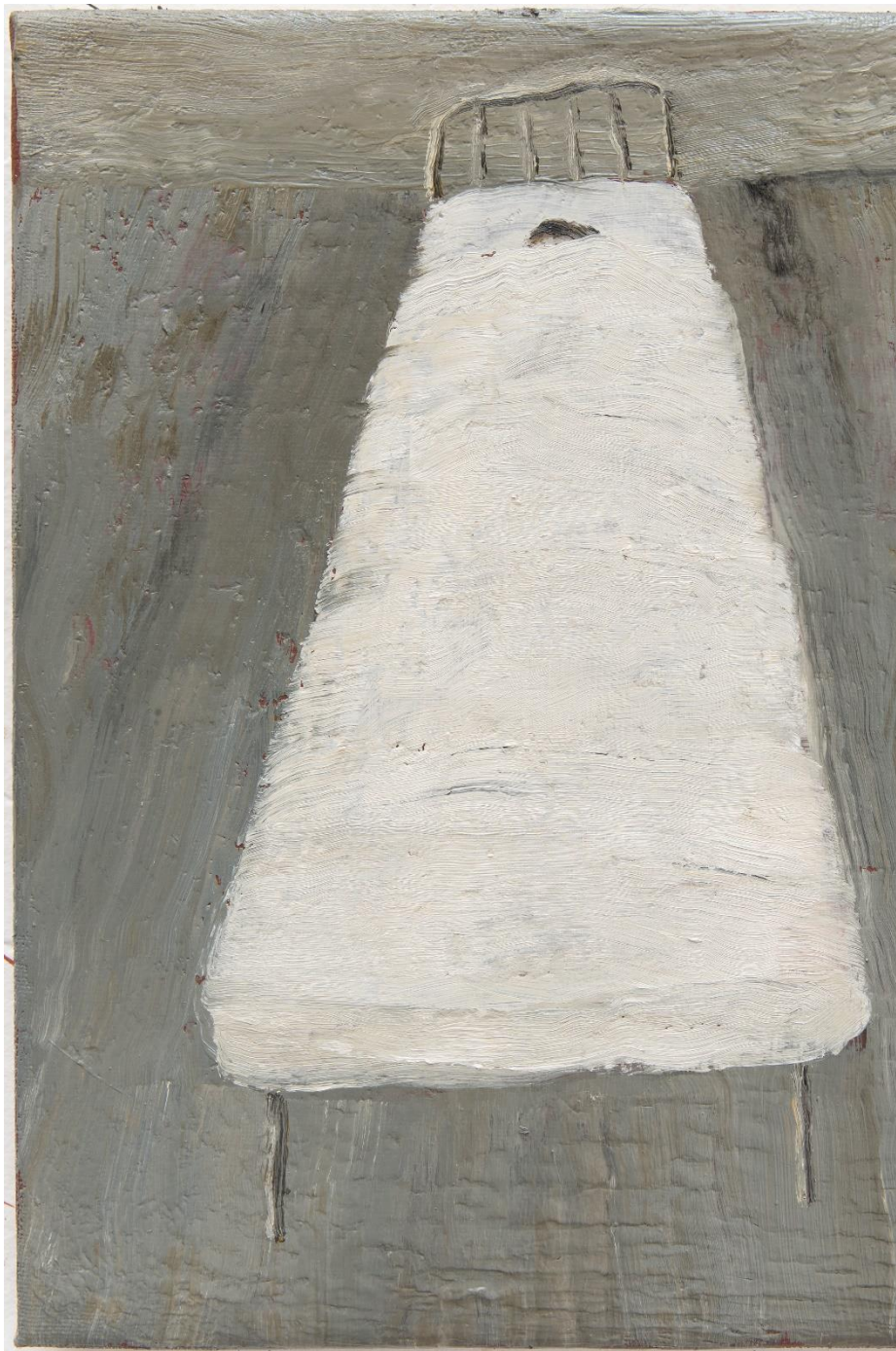
Sleeping, 2022 Óleo sobre lienzo 27 x 22 cm