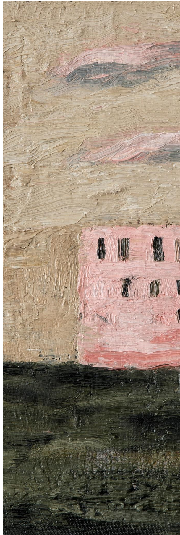
Fábrica, 2018 Óleo sobre lienzo 30 x 30 cm