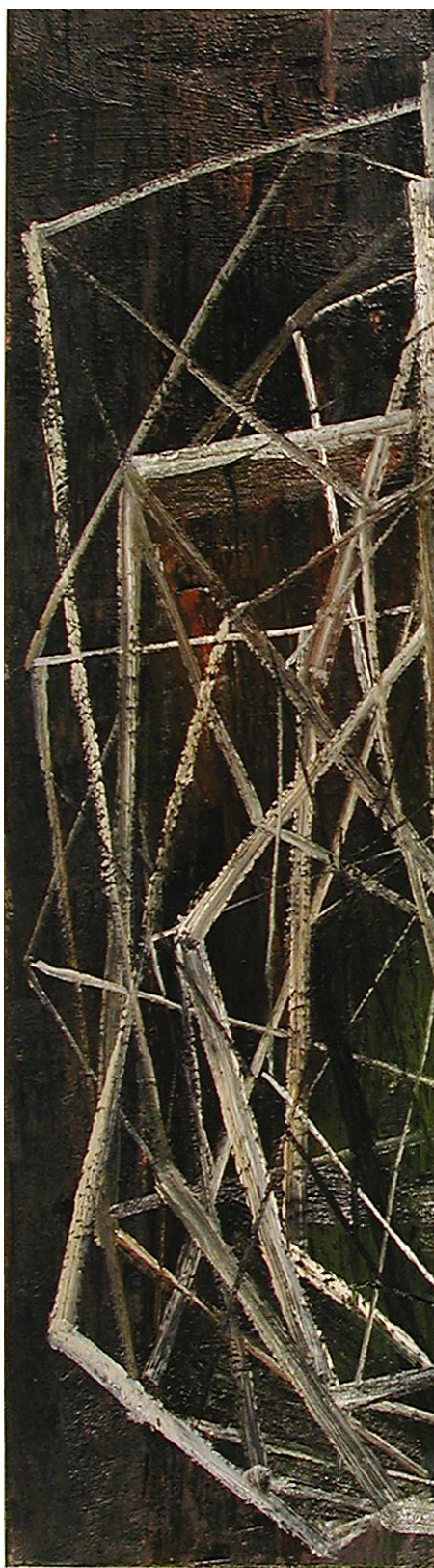
Poliedro, 2003 Óleo sobre lienzo 150 x 150 cm