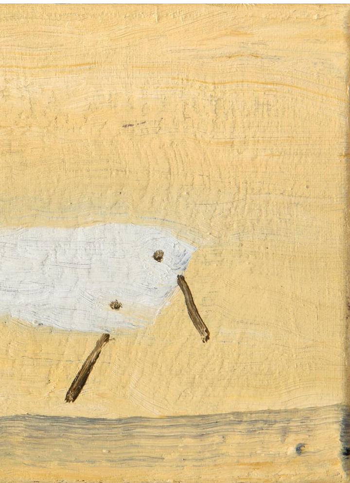
, 2021 obre cartulina 29 cm