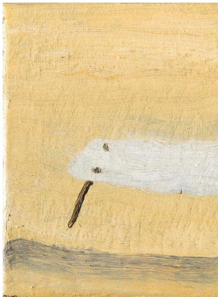
Canapé Tinta china sobre 39 x 39