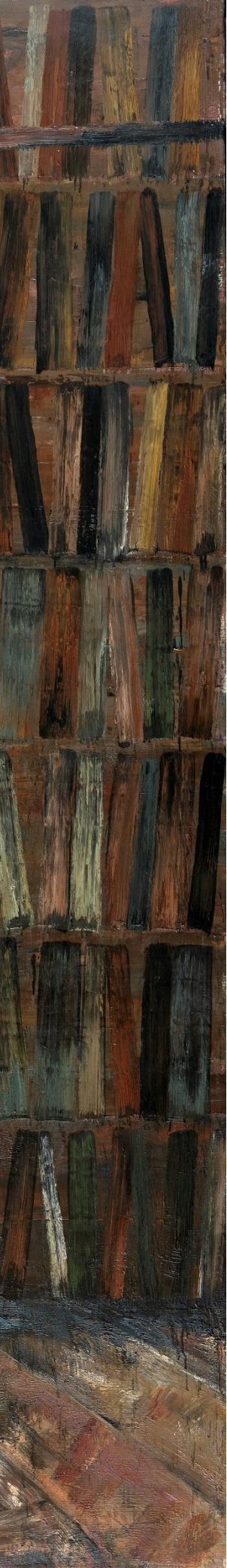
Biblioteca, 2007 Óleo sobre lienzo 240 x 200 cm