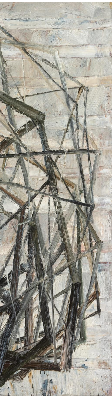
Poliedro, 2003 Óleo sobre lienzo 130 x 130 cm